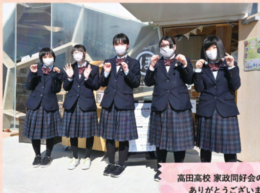
高田高校 家政同好会のみなさん ありがとうございました！

今後も販売する作品の内容を変えながら、募金活動を続けていきたいと考えているそうです。意欲のある若い世代の、今後の活躍に期待ですね！